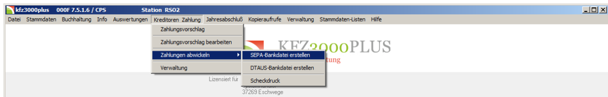
Abbildung 10: Aufruf - SEPA Bankdatei erstellen

Mit dem Aufruf in Abbildung 10 beginnen Sie die Erstellung der SEPA-Bankdatei . Dadurch gelangen Sie in die folgende Maske: