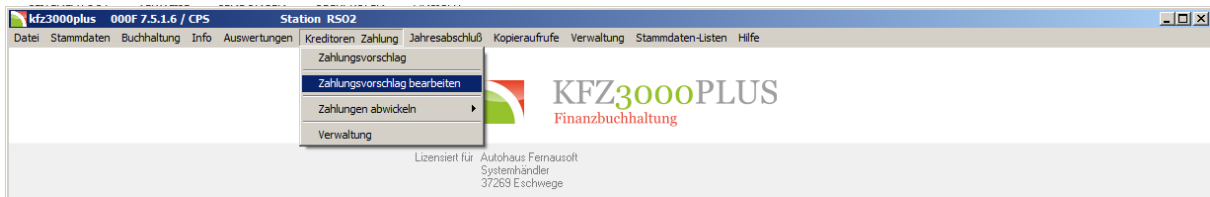
Abbildung 8: Aufruf - Zahlungsvorschlag bearbeiten

Sie können den Zahlungsvorschlag bearbeiten . Einzelbuchungen, die nicht bezahlt werden sollen, können beispielsweise gelöscht werden.