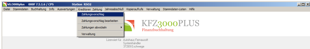
Abbildung 5: Aufruf - Zahlungsvorschlag

Aus den vorher eingebuchten Rechnungen können Sie einen Zahlungsvorschlag generieren. Den Zahlungsvorschlag können Sie entsprechend anpassen: