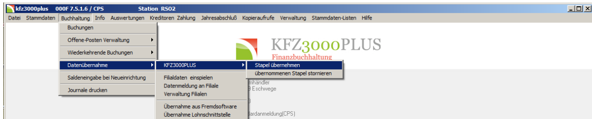
Abbildung 13: Aufruf - Stapel übernehmen

Nachdem Zahlungen erfolgt sind, können Sie den entsprechenden Stapel in der Finanzbuchhaltung übernehmen. Dadurch bucht das Programm die Buchungen als „bezahlt“.