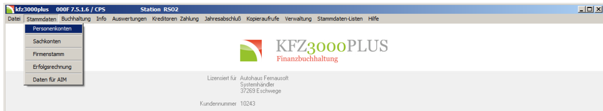
Abbildung 3: Aufruf - Stammdaten Personenkonten

In den Personenkonten müssen Sie sicherstellen, dass die Bankverbindung bei den Kreditoren hinterlegt ist. Die Informationen werden in der Karteikarte: Fibu hinterlegt: